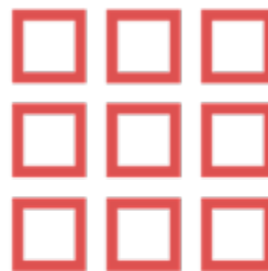
SDGs 創新教育與策展 SDGs Education & Curation