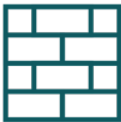
老屋新生與空間營運 Space Innovation & Operation