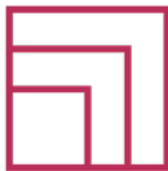
社會創新孵化與加速 Incubation & Acceleration